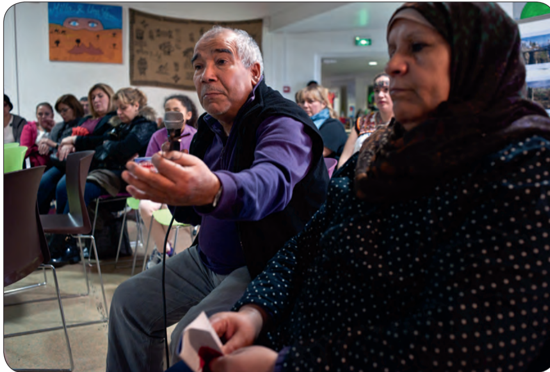
Durant la soirée mémorielle d'octobre 2015, les habitants prennent la parole. (© Julien Jaulin • Archives 2015).

Ce web-documentaire propose un voyage interactif vidéo, photographique, sonore et littéraire sur ces événements. Ce web-documentaire retrace de façon précise cette soirée du 17 octobre 61 et la replace dans le contexte de la guerre d'Algérie, en