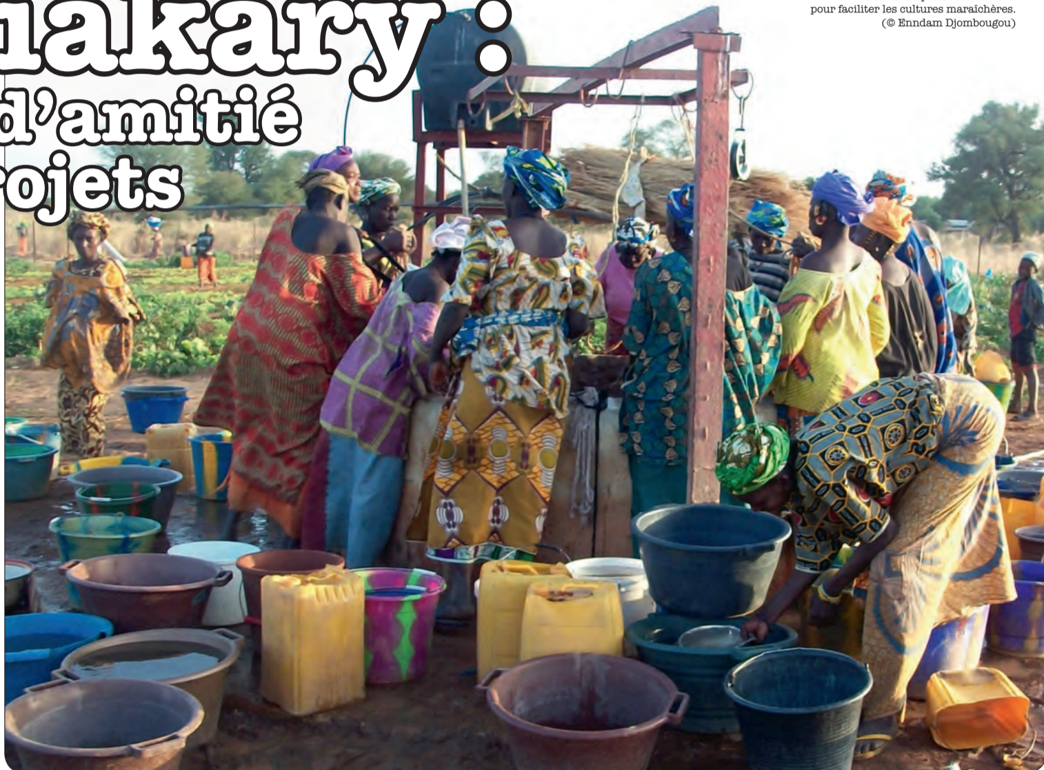
Les femmes de Koniakary autour du puits foré en 2011 pour faciliter les cultures maraichères.

Koniakary-Villetaneuse, ce sont 10 ans d'amitié, de travail et de projets en commun. Pour célébrer cet anniversaire, le Maire de Koniakary, Bassirou Bane, accompagné d'une délégation de quatre personnes, est reçu à Villetaneuse jusqu'au 16 octobre. Voir page 3.