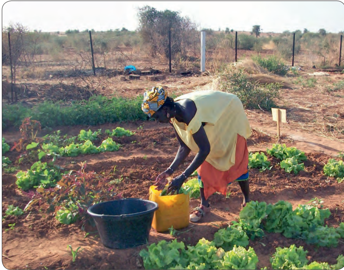
Le développement de la culture maraîchère est l'un des postes importants de la coopération entre Koniakary et Villetaneuse.

Belle implication de la jeunesse La coopération s'est ensuite étendue à d'autres partenaires. La Fondation Jeunesse Feu Vert a organisé un chantier à Koniakary pour construire un mur pour le collège. Un groupe de jeunes Villetaneusiens en garde un souvenir riche. Ce sont ensuite les jeunes de l'IPJV (Instance Participative de la Jeunesse de Villetaneuse), accompagnés par l'association Enndam Djombougou, qui ont mis toute leur énergie dans la construction d'une